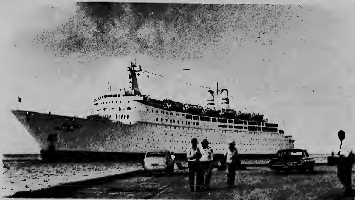
Ayera mainta e bapor di turista "Shalom" a drenta haf di Oranjestad cu un total di 591 turista a bordo. Na Aruba e bapor aki ta representa pa e firma S.E.L. Maduro & Sons, cual firma ayera tardi a tene un recepcion na ocasion di e prome bishita aki, pa algun invitadonan. E bapor a sali awe marduga pa mas o menos tres o or.

Lo no ta imposibel - segun e comunicado - cu e fecha di yegada di e prome ferry lo ta den e week-end di carnaval na Aruba.